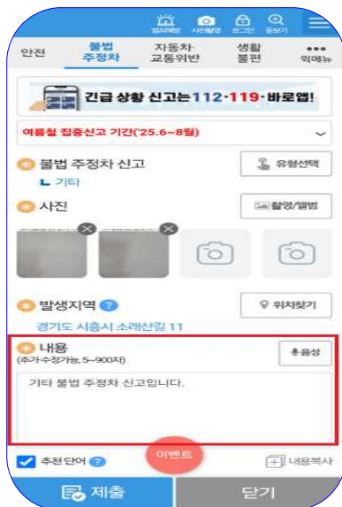
⑧ 내용 작성