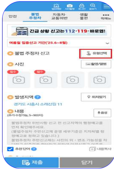
② 유형선택: 기타