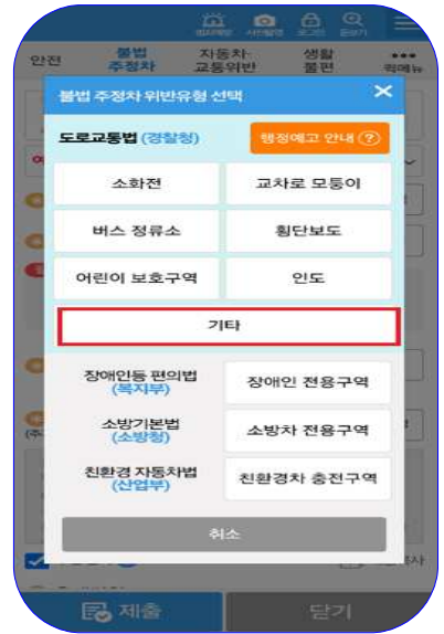
③ 기타 불법 주정차