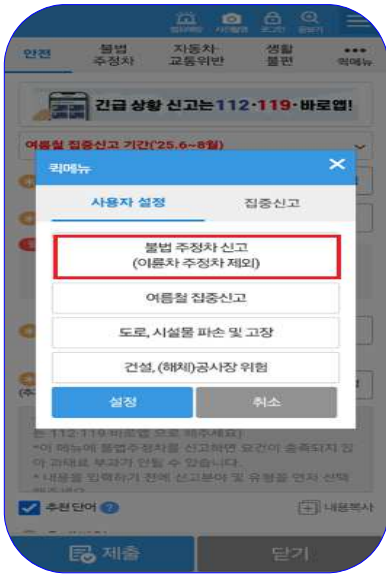
① 불법 주정차 신고