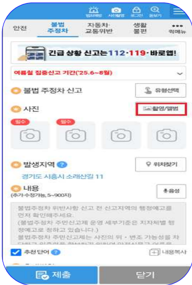
④ 무단주차 사진 업로드